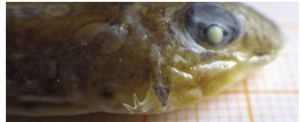
Abb. 7: Ein konserviertes ♂ vom Ornament-Leierfisch, Callionymus reticulatus , mit freipräparierten Präoperkularstacheln. Die drei relativ kleinen Stacheln zeigen nicht in Schwimmrichtung.

Der Gestreifte Leierfisch benötigt eine möglichst ausgedehnte Sandfläche im Aquarium, die seinem natürlichen Habitat ähnlich ist und außerdem ein paar Versteckmöglichkeiten bietet. Männliche Leierfische zeigen meist territoriales Verhalten und reagieren aggressiv gegenüber männlichen Exemplaren der eigenen Art (Fricke 1986), gegenüber anderen Fischarten soll die Art sich aber im Allgemeinen friedlich verhalten (Leiendecker 2011). Jes (1976) rät zu Vorsicht, da C. lyra zwar eine am Boden lebende Art ist, im Aquarium sich aber als ausgezeichneter Springer erwiesen hat. Nach Neumann & Paulus (2005) soll die Wassertemperatur zur Aquarienhaltung 14 bis 20 °C und nach Leiendecker (2011) nur 14