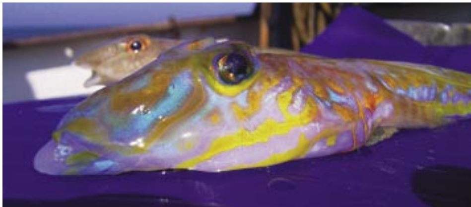
Abb. 1: Der Gestreifte Leierfisch, Callionymus lyra , aus der deutschen AWZ der Nordsee. Im Vordergrund ein ♂, im Hintergrund ein ♀.