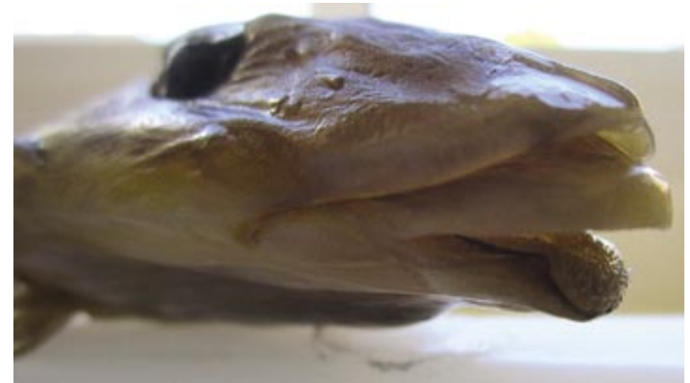
Abb. 4: Das Maul eines Gestreiften Leierfisches (konserviertes ♂). Zu sehen ist der vorstülpbare Oberkiefer und die Bezahnung am Unterkiefer.