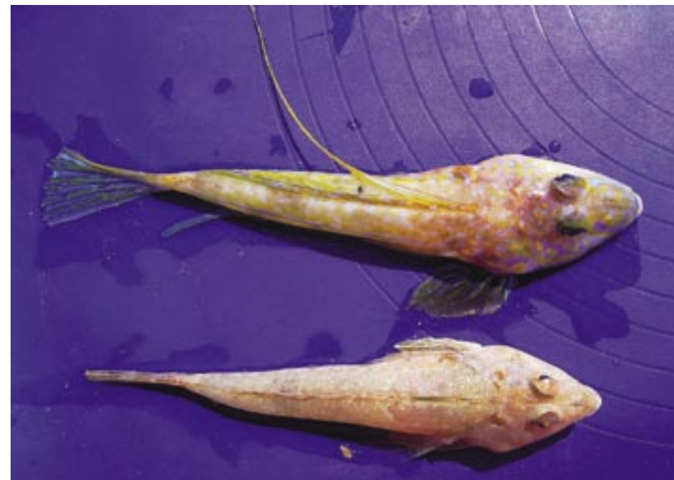
Abb. 2: Der Gestreifte Leierfisch, Callionymus lyra , unten ♀, oben ♂, in Dorsalansicht, nach dem Fang. Die auf der Körperoberseite gelegenen Kiemenöffnungen sind besonders beim ♀ gut zu erkennen.