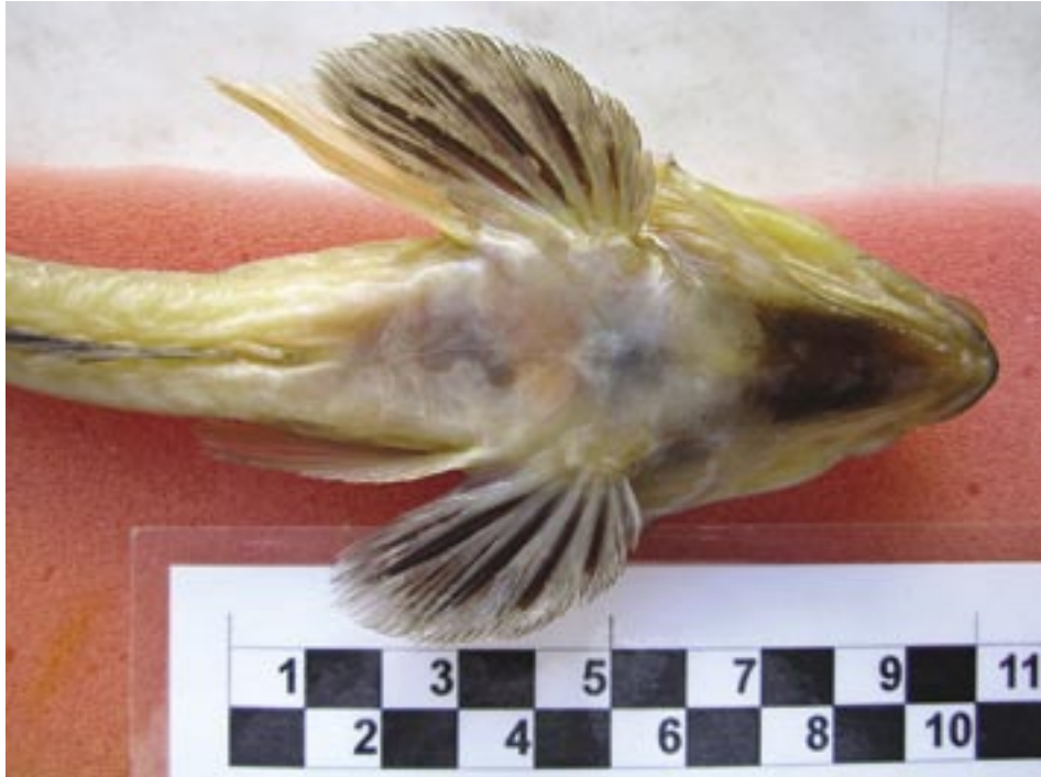
Abb. 3: Ventralansicht eines männlichen Gestreiften Leierfisches (konserviertes Tier). Die kehlständigen Bauchflossen, die Brustflossen und die Analpapille sind zu sehen.

sandfarben, braun und grün marmoriert mit dunklen Satteln auf dem Rücken getarnt. In der Vergangenheit führte dies sogar dazu, dass beide Geschlechter als zwei Arten beschrieben wurden. Während ein ♂ eine Totallänge (TL) bis 30 cm erreichen kann, wird ein ♀ nur bis 20 cm lang (Wheeler 1978, Muus & Nielsen 1999). Andere Autoren geben höhere Maximallängen an, für ♀♀ bis 25 cm (Mohr 1928, Duncker & Ladiges 1960), für ♂♂ sogar bis zu 43 cm (Heessen et al. 2015).