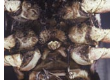
Abb. 2: Annulus ventralis als helle rundliche Scheibe in der Bildmitte.

im September/Oktober. Die Männchen suchten die fortpflanzungsfähigen Weibchen, welche nun auch an den markanten weißen Flecken auf der Unterseite des Schwanzfächers (Uropoden) ihre Fortpflanzungswilligkeit anzeigten (Abb. 3). Über diese weißen Flecken werden Pheromone ausgeschüttet, welche die Männchen anlocken sollen.