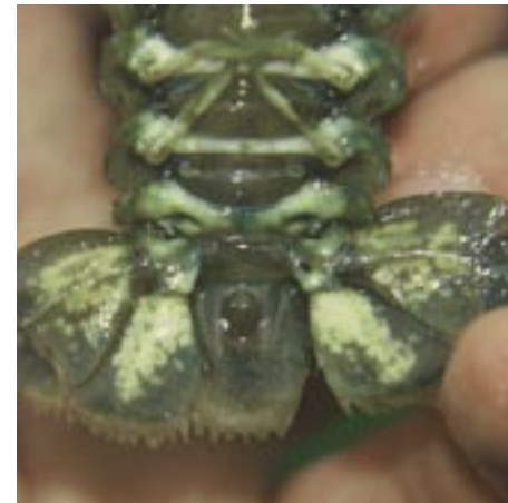
Abb. 3: Schwanzfächerunterseite des Weibchens mit weißen Pheromonflecken.

Das Verhältnis zwischen Männchen und Weibchen betrug im Mittel 3:1.