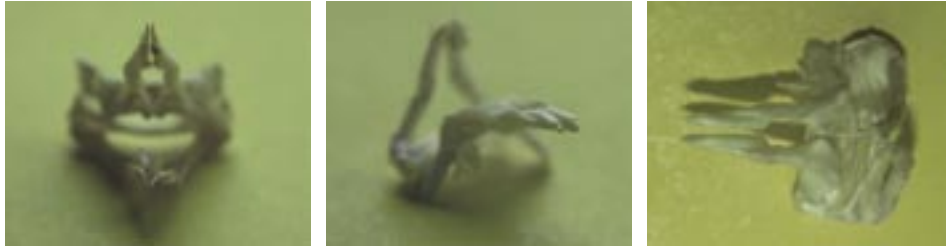
Abb. 4: Spitze harte Petasmenform der fortpflanzungsaktiven Form.