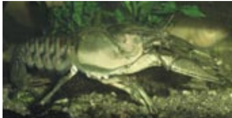
Abb. 1: Weibchen von Orconectes limosus .

Für die Untersuchung wurden 1114 Krebse aus dem 240 ha großen Tagebau-Restsee „Mortkaer Loch“ bei Mortka, Sachsen gefangen. Die Fänge erstreckten sich von Anfang August bis Anfang September 1996. Als Fanggeräte wurden Krebskörbe und sieben Großreusen vom Typ einer Schwalg-Reuse mit einer Maschenweite von 18 mm des ansässigen Fischereibetriebes verwendet. Die Fanggeräte waren gleichmäßig um den See verteilt. Bedingt durch die Maschenweite der Fanggeräte unterschritt die durchschnittliche Körperlänge der untersuchten Krebse selten 9 cm. Die Unterscheidung von bereits gehäuteten und nicht gehäuteten Krebsen erfolgte durch Druckprobe auf den Panzer (bei frisch gehäuteten war dieser weicher und ließ sich eindrücken) und durch die Farbe des Panzers (frisch gehäutete Krebse waren hell braun bis ocker gefärbt) und ohne Fadenalgenaufwuchs oder Dreikantmuschelauflauf ( Dreissena polymorpha ). Die gefangenen Krebse gingen nach der Untersuchung als Speisekrebse in den Handel. Damit war ein Rückfang schon untersuchter Krebse ausgeschlossen.