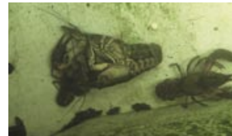
Abb. 8: Begattung unmittelbar nach dem Fang im Fischkasten.